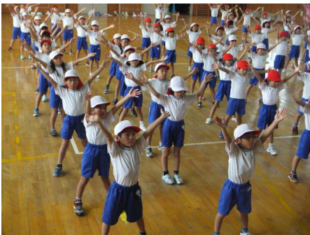
←1・2年「Share The World」好きなアニメ「ワンピース」の曲に乗って決めます！

運動会特別時間割が始まって1週間がたちました。連学年で行う表現を、ちょっとだけご紹介いたします。子ども達は、運動会の本番でうちの方や地域の方々に見ていただくのを楽しみに、練習に励んでいます。9月22日（土）は、ぜひ井上小学校校庭へお出かけ下さい。お待ちしております。