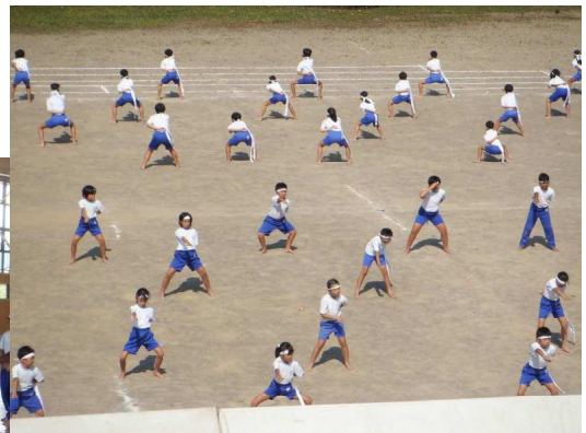
←5・6年 組体操 みんなの気持ちと息を合わせ て、成功させるぞ！