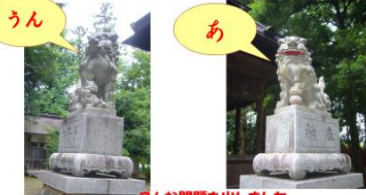
こんな問題も出しました。

正解：神社にいる「これ」は狛犬 狛犬は、右が「あ」左が「うん」と言っている。日本全国同じ。狛犬でなくても だいたい「あ」「うん」。阿吽の呼吸